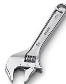
Разводной водопроводный ключ с широким зевом