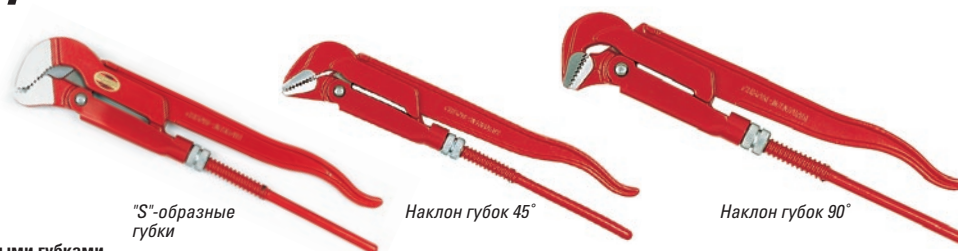
Модель с "S"-образными губками